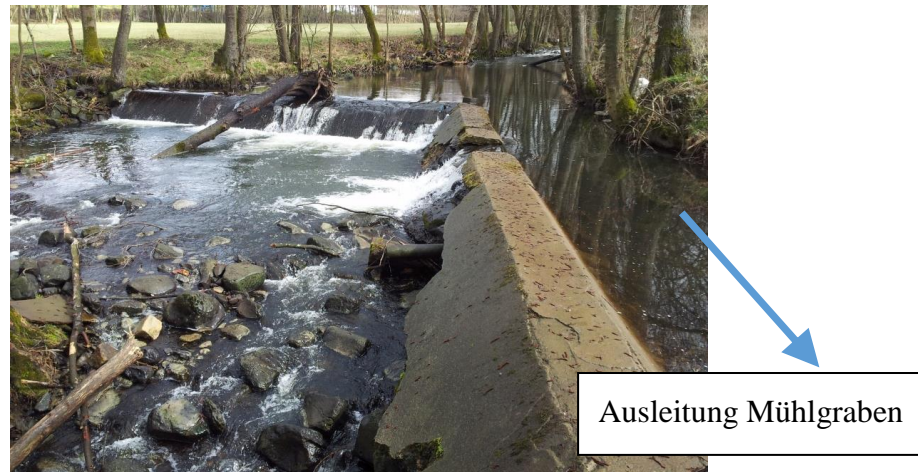
Abbildung 1: Wehrbauwerk in der Salz mit seitlicher Ausleitung in den Mühlgraben

Im betrachteten Abschnitt ist das Gewässerbett weitgehend frei von anthropogenen Einflüssen, weshalb die Errichtung eines technischen Fischpasses bei Erhalt des Wehres als unbefriedigende und zudem aufwendige Lösung erschien.