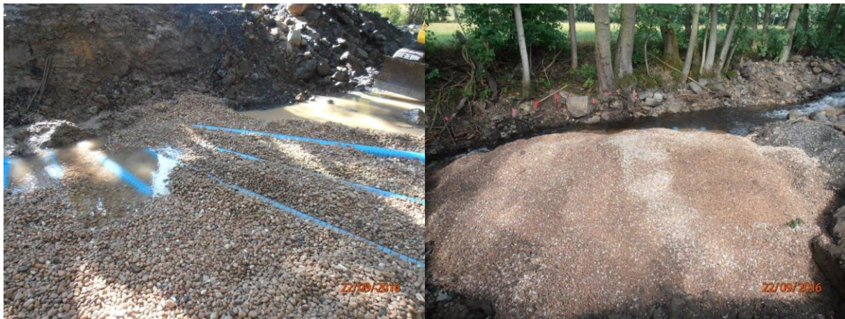
Abbildung 6: Kiesrigole mit Drainagerohren – links: Blickrichtung Sammelschacht, rechts: Blickrichtung entgegengesetztes Ufer

Wie in Abbildung 7 dargestellt wurde die Sickerrigole seitlich und von oben mit Geotextil einer Schichtdicke von 6,7 mm und einer Flächenmasse von 828 g/m 2 abgedeckt. Die charakteristische Öffnungsweite von 0,08 mm verhindert den Eintrag von Feinmaterial in die Rigole. Die Drainagerohre wurden nicht in Geotextil gefasst, damit eventuell in die Rigole eingetragenes Material wieder ausgeschwemmt werden kann. Auf diese Weise bleiben sie spülbar. Ober- und unterhalb der Rigole wurde die Gewässersohle mit einer Reihe großer Steine gesichert, die auch das Geotextil fixieren.