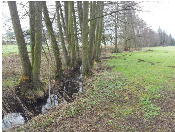
Abbildung 3: Mühlgraben oberhalb der Ortslage Romsthal

Abbildung 3 zeigt den oberen Abschnitt des Mühlgrabens, bevor dieser die Ortslage Romsthal erreicht.