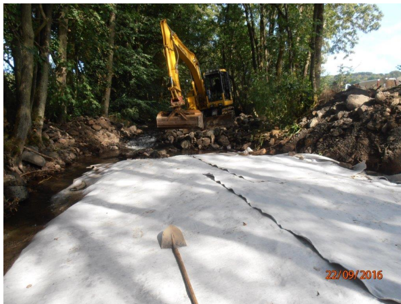
Abbildung 7: Mit Geotextil eingefasste Rigole

Wie in Abbildung 7 dargestellt wurde die Sickerrigole seitlich und von oben mit Geotextil einer Schichtdicke von 6,7 mm und einer Flächenmasse von 828 g/m 2 abgedeckt. Die charakteristische Öffnungsweite von 0,08 mm verhindert den Eintrag von Feinmaterial in die Rigole. Die Drainagerohre wurden nicht in Geotextil gefasst, damit eventuell in die Rigole eingetragenes Material wieder ausgeschwemmt werden kann. Auf diese Weise bleiben sie spülbar. Ober- und unterhalb der Rigole wurde die Gewässersohle mit einer Reihe großer Steine gesichert, die auch das Geotextil fixieren.