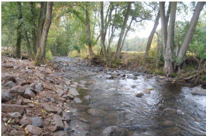
Abbildung 8: Flussbett der Salz im Bereich der fertiggestellten Sickerrigole

Das Sohlsubstrat entspricht dem ober- und unterhalb anstehenden Material, so dass bisher auch bei einer abflussbedingten Substratverlagerung keine nennenswerten Veränderungen der Gewässersohle aufgetreten sind.