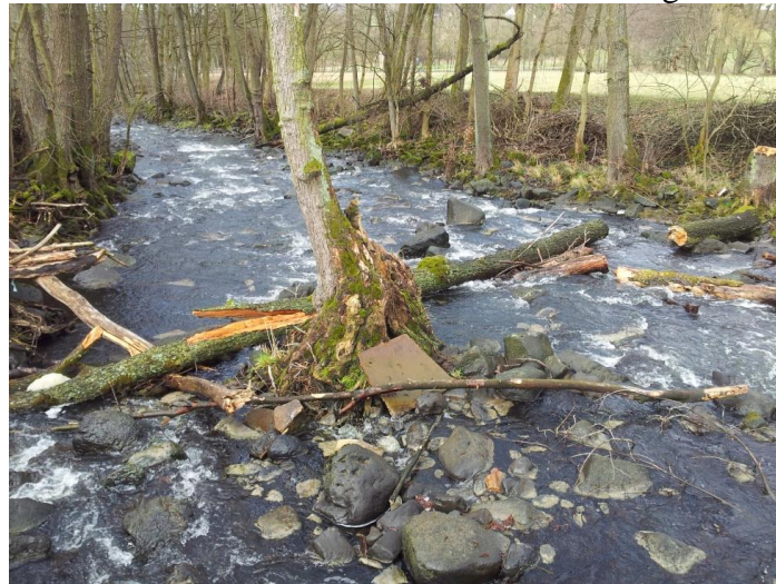
Abbildung 2: Unterlauf des Wehres, Zustand des unbeeinflussten Gewässers